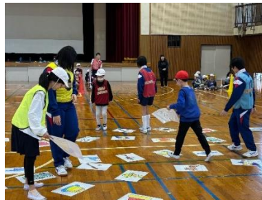
特別支援学級交流